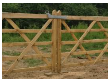
Set beslag voor dubbele poort