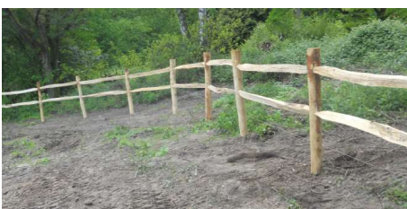
Bouwpakket Post & Rail omheining beschikbaar in verschillende uitvoeringen met 2 of 3 liggers