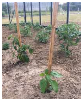
Kastanjepalen voor de moestuin