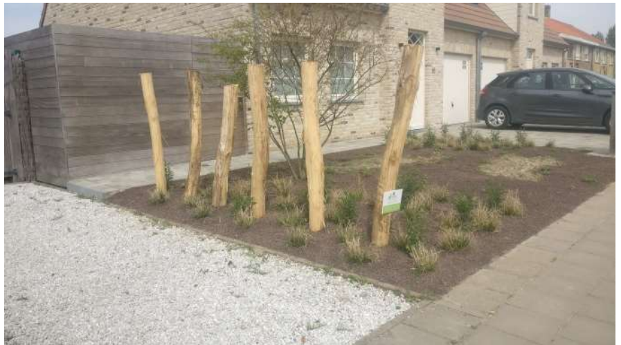
Robinia palen gepeld en gepunt - 'Super Natuurlijk'