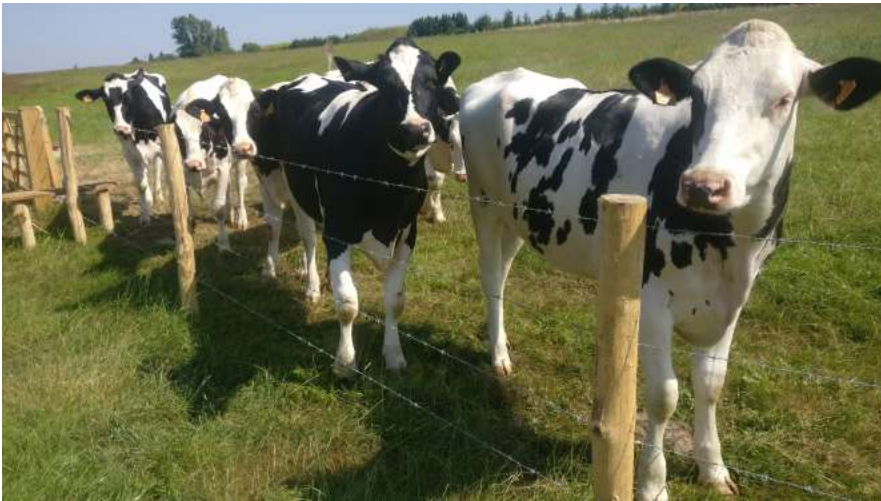
Robinia palen gepeld en gepunt

Vind je niet wat je zoekt? Vraag ons naar de andere mogelijkheden of afmetingen. (* ) Niet altijd op voorraad