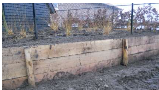
Waterwerken & kleine grondkeringen