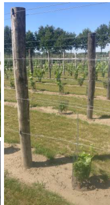
Kastanjepalen tot 5m op bestelling