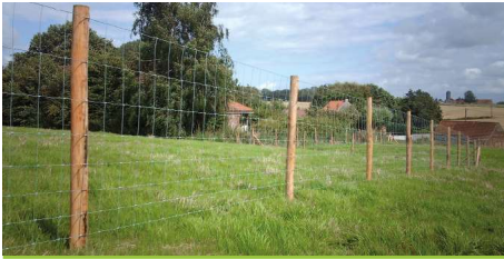
Bouwpakket Multifunctionele tuin- en dierenomheining