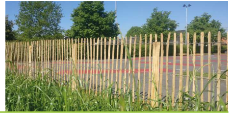
Bouwpakket Kastanje hekwerk