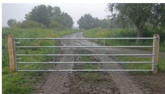
Uitschuifbare metalen poort