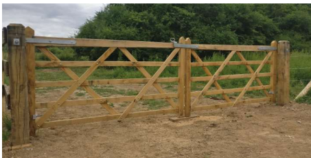
Bouwpakket Engelse veldpoort in eik beschikbaar in enkele en dubbele uitvoering