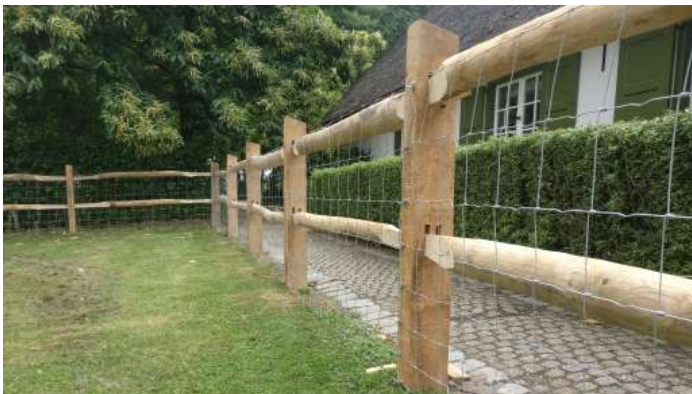
Rechthoekige paal met afgeschuinde kop