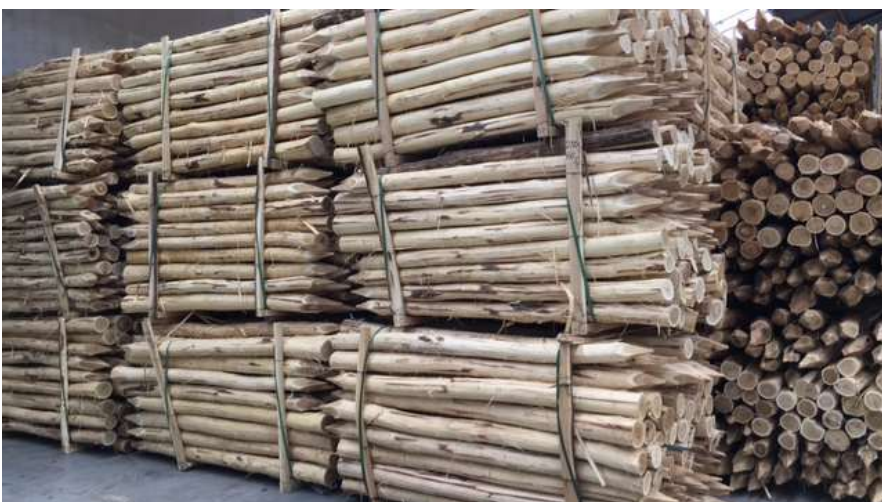
Ronde Robinia palen gepeld en gepunt