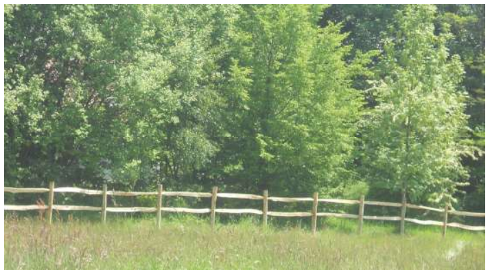
Gekliefde ligger in kastanje