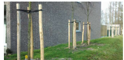
Bouwpakket Boomsteun voor de professionele boomplanter