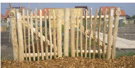
NIEUW Bouwpakket Enkele en dubbele kastanjeport