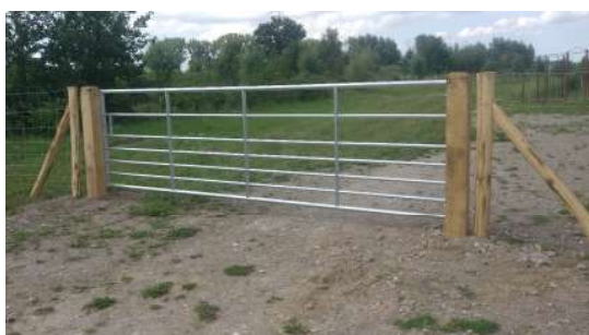
Vaste metalen poort