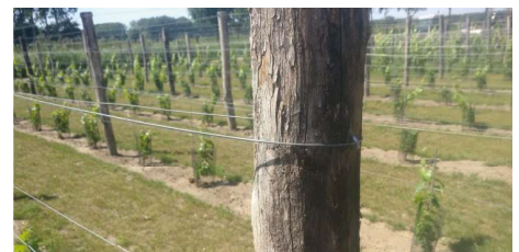
NIEUW Bouwpakket Steunconstructie voor de wijngaard