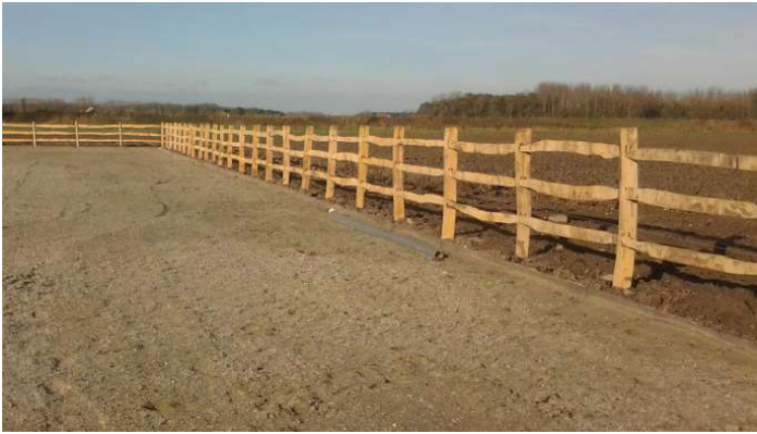
Halfronde paal in kastanje

Vind je niet wat je zoekt? Vraag ons naar de andere mogelijkheden of afmetingen. (* ) Niet altijd op voorraad