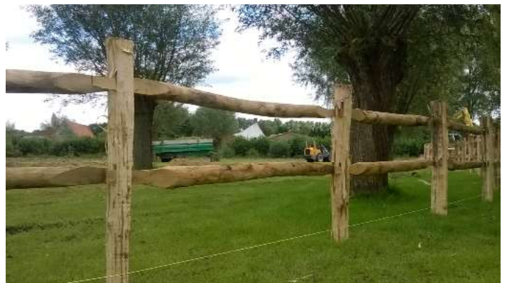
Halfronde paal in Robinia