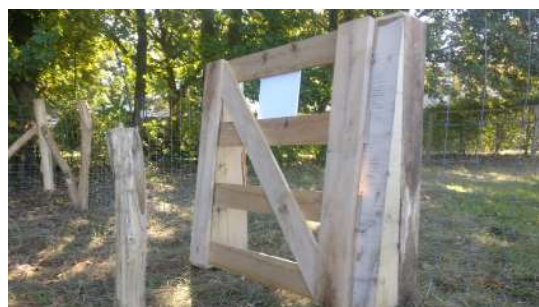
Klappoort in eik